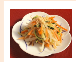
画像はイメージです

旬の横浜野菜を使った家庭料理を再現しやすいようにわかりやすく丁寧に解説します！ お料理初心者や基礎から学び直したい方にもおすすめです。※男性大歓迎！